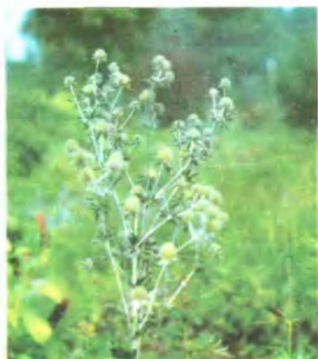
457. Миколайчики плоскі.